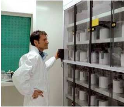
Mischungssystem (agitatorisches Möbel), um die Basisfarben zu lagern Meuble agitateur, stockage des teintes de base

Diese Kabine ist mit der Norm NFT 35014 vom Dezember 2004 konform. Ein Arbeitstisch mit Abluftabsaugung über Filter, zur Lackiervorbereitung. Matériel conforme à la norme NFT 35014 décembre 2004 avec table de travail ventilée