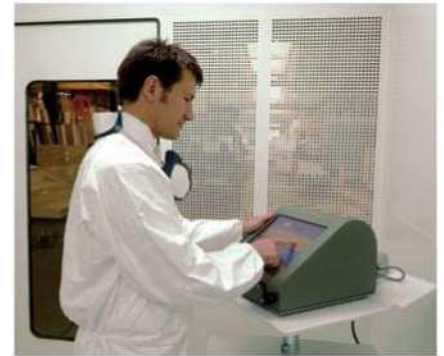
Herstellung von den genauen Farben des Fahrzeugherstellers Formulation et fabrication des teintes constructeurs